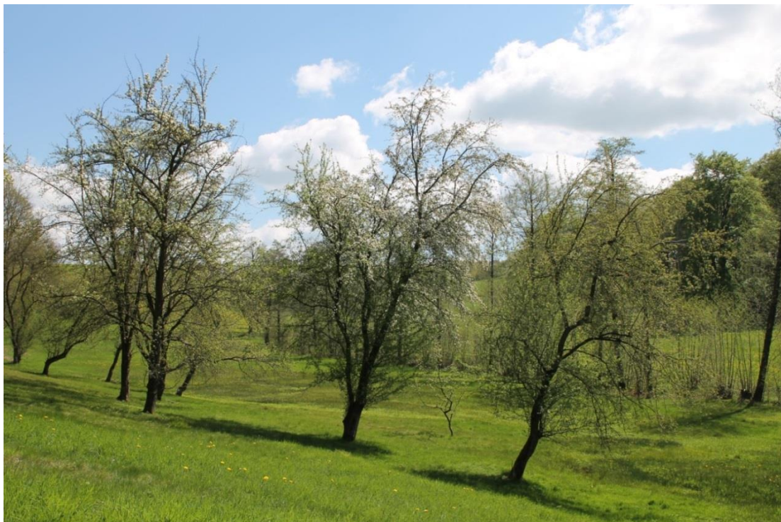
Eines der seltenen Wildapfelvorkommen in Sachsen, in dem mehrere Wildapfelbäume in einer Gruppe stehen.

Kann eine Hybridisierung in dem Vorkommen nicht ausgeschlossen werden, oder wird die Mindestanzahl von fruktifizierenden Individuen nicht erreicht und sind Verdichtungspflanzungen nicht möglich, sollte das Vorkommen nicht als Erntevorkommen ausgewiesen werden.