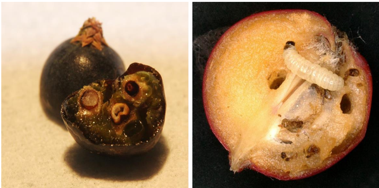
Prüfung des Saatgutes auf Vollkornanteil (linkes Bild Früchte mit Samen von Wacholder) bzw. Befall durch Schädlinge (rechtes Bild: Befall der Eberesche durch die Ebereschensfruchtmotte ( Argyresthia conjugella ))

Vor einer Beerntung sollte kontrolliert werden, ob der Fruchtbehang ausreichend für eine Beerntung ist. Weiterhin sollten die Früchte bzw. Samen auf einen Schädlingsbefall kontrolliert werden, sowie einzelne Samen aufgeschnitten werden, um den Vollkornanteil abschätzen zu können. Zeigen die Samen einen unerwartet hohen Anteil an Hohlkörnern bzw. sind die Samen durch Schädlingsbefall beschädigt, muss abgewogen werden, ob sich eine Beerntung lohnt.