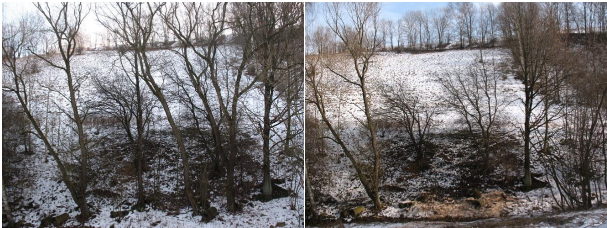
Stark überschilderte Wildapfelbäume vor und nach der Freistellung. Durch die Entnahme von fünf Bedrängern sind die seltenen Wildobstgehölze wieder ideal besontt.

Eine Nachpflege der Standorte ist zu gewährleisten, insbesondere bei der Entnahme stockausschlagsfreudiger Gehölze (Pappel, Ahorn) oder dem Rückschnitt starkwüchsiger Sträucher (insbesondere Schlehe, Wildrosen).