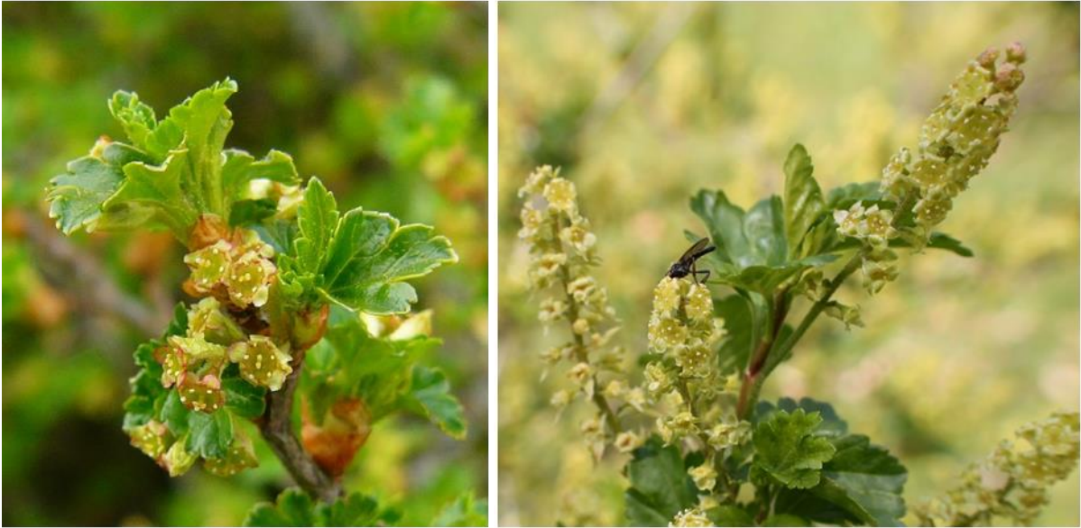
Weibliche (linkes Bild) und männliche Blüten (rechtes Bild) bei der Alpen-Johannisbeere (Ribes alpinum)