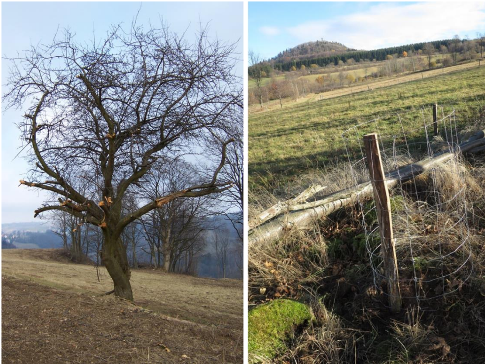
Verstümmelung eines Wildapfels infolge eines Freischnittes von Grünlandrandbereichen (linkes Bild). Verdichtungspflanzung von Alpen-Johannisbeere in Randbereichen eines Erntebestandes mit dauerhaftem Einzelpflanzenschutz (rechtes Bild)

Schwierig hinsichtlich der Sicherung von Erntebeständen ist die Zuständigkeit und Finanzierung dieser Arbeiten. Da es sich jeweils um verschiedene Einzelfälle mit meist mehreren beteiligten Eigentümern, verschiedenen Interessenlagen der Bewirtschafter sowie stets arbeitsintensiven Pflegeeingriffen bei entsprechender Notwendigkeit handelt, sind Planungsaufwand, Kosten und Personaleinsatz hoch.